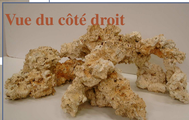
Vue du côté droit

Pour : Bac d'ensemble Cichlidés Eau de mer